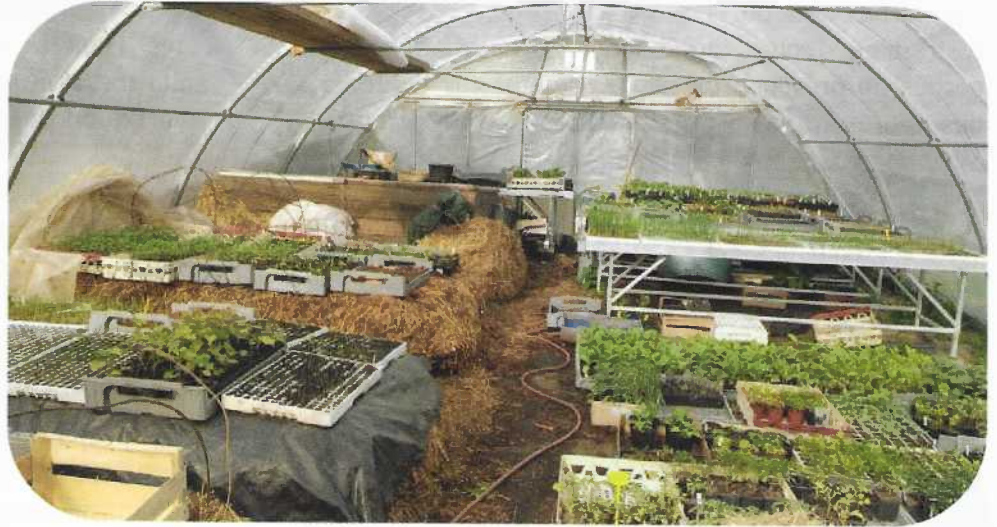
Des plants chauffé au fumier

Je suis présent sur plusieurs marchés, en plus de la vente en direct le mercredi et le samedi de 16h30 à 19h. Vous pouvez me retrouver le vendredi à Champagné St Hilaire (16h-19h), à Vivonne le samedi matin, et à Fontaine le Comte le dimanche matin. Maintenant je souhaiterais agrandir avec un terrain d'un hectare pour un verger. Si quelqu'un en connaît un près de chez nous, il peut me contacter.